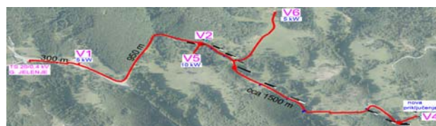
Slika 3: NN strujni krug napajan iz TS Jelenje