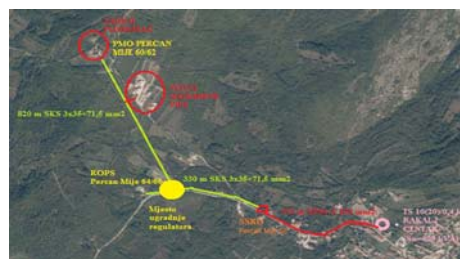
Slika 4: NN strujni krug napajan iz TS Rakalj centar