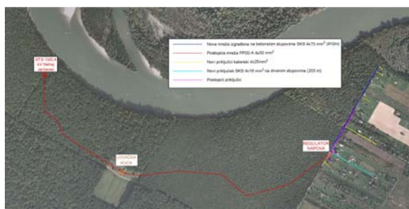
Slika 2: Vikend naselje Suševine, Petrijevci