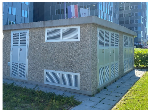
Slika 3 – TS 10(20)/0,4 kV 2x2000 kVA