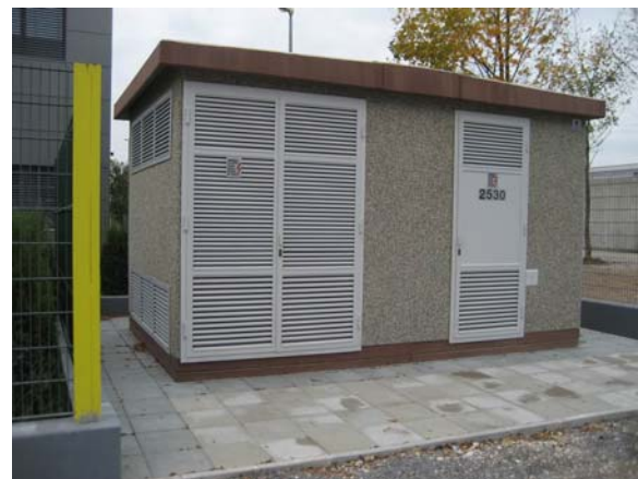
Slika 2 – TS 10(20)/0,4 kV 1x2000 kVA